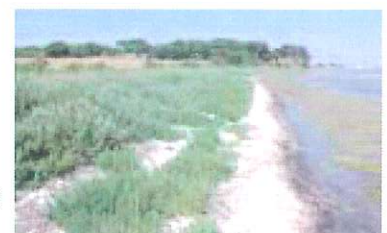
Site des Prés du Baugé

En 2005, les diagnostics écologiques ont été complétés et les cahiers des charges d'exploitation affinés. Sur l'étang de Vendres, la démarche a abouti à la signature par un exploitant d'un Contrat d'Agriculture Durable en lien avec la conservation de milieux remarquables (voir chapitre : La gestion agro-pastorale des Basses Plaines de l'Aude).